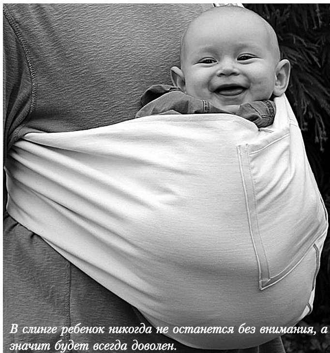
В слинге ребенок никогда не останется без внимания, а значит будет всегда доволен.