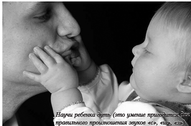
Научи ребенка дуть (это умение пригодится для правильного произношения звуков «с», «ш», «з»)

Эта статья поможет тебе лучше понимать естественный процесс развития речи ребенка, и подскажет, как ты можешь развивать своего наследника. Полная версия доступна на нашем сайте в бесплатном доступе.