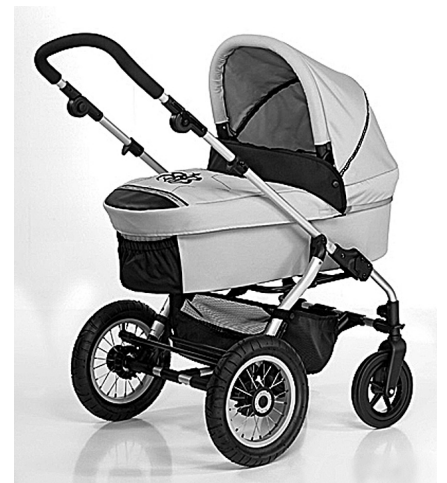
Такая коляска нужна малышу первые 6–8 месяцев.

После года обязательны книжки с толстыми листами и яркими картинками или просто набор карточек (переход к наглядно-образному мышлению). Также выпускаются такие книжки из непромокаемых материалов, малыш сможет брать их с собой на купание. Малыши с удовольствием разглядывают, мнут и рвут обычные журналы с цветными иллюстрациями. Очень хорошие развивающие игрушки — разнообразные ящички с прорезями разных форм, куда нужно просовывать соответствующие предметы (шар, кубик, параллелепипед, цилиндр, звездочку).